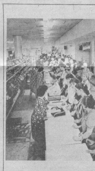
Шу куннинг мавзуида

1-Май кўчасидаги «Болалар дунёси» магазинининг филиали ҳам бозор тусини олган. Кийимлар бўлимида ўғил ва қиз болаларнинг ёғи-қичи кийимлари сотилапти. — 7 ёшли ўғил болага ёғи кийим борми? — сўради навбати келган харидорлардан бири. — Марҳамат. — 42-ўлчамли ўғил болаларниқидан бериб юборинг. — Катта ўлчамдагиларни умуман йўқ. Эски шахардаги бош магазинимизга бориб кўринг, балки топилар.