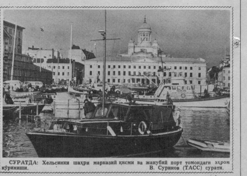
СУРАТДА: Хельсинки шаҳри марказий қисми ва жанубий порт томондаги эҳром кўриниши.

энг катта аҳоли пунктларида-ги турмуш шартларини тур-тинчи марта йиллик тадиқ этиш натижалари билан асослайди. Атроф-муҳитнинг ҳолати, меҳнатга жойлашти-ш ва ҳордиқ чиқариш имко-ниятлари, шунингдек кун кечилиш қиймати сингари хилма-хил омиллар хисобга олиниб баҳо берилган. Вашингтоннинг шимоли-гарбий соҳилидаги аҳолиси атиги 180.900 кишидан ибо-рат бўлган Времертон шаҳри-га ана шу барча кўрсаткич-лар жиҳатидан тенг келади-ган шаҳар йўқ, деб ҳисоблай-ди журнал. «Мани» жур-налининг таъкидлашча, ана шу шаҳарда «атроф-муҳит тоза, меҳнатга жойлашти-ш ва ҳордиқ чиқариш учун им-кониятлар кўп, шунингдек уй-жойлар нархи афсон ва иш жойида хавфли стресс ҳо-лати намдир».