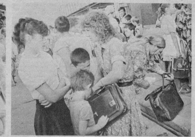
© Янгиликлар билан Д. ОБЛАЕВ таништирди.