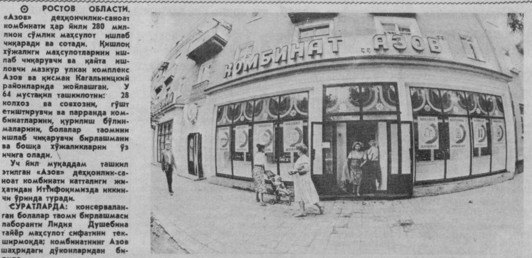
Уч йил муқаддам ташкил этилган «Азов» деҳқончилик-саноат комбинати катталиги жаҳатдан Иттифоқимизда иккинчи ўринда туради.