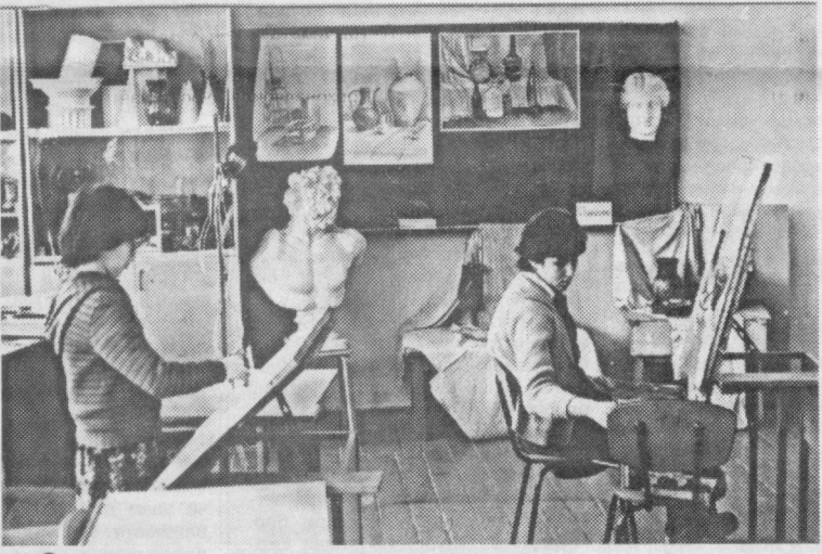
Санъат асарлари яратиладиган устхонада.

Танловнинг Тошкент шаҳри бўйича босқичи учун асарлар 1999 йил 15 февралга қадар қуйдаги манзилга етказилиши лозим: 700031, Тошкент, Д. Қунаев кўчаси, 15-уй, Болалар бадий ижодиёти республика маркази. Тел: 56-62-29, 54-79-37.