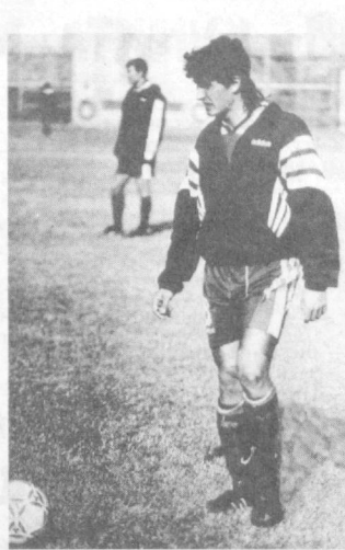
роитлар ваъда қилишган бўлса-да, рад жавобини бердик.

иштирок этамиз. 12 февралда Осиё Кубок эгалари Кубогининг чорак финал баҳсида Саудия Арабистонининг Жидда шаҳрида Осиёнинг энг кучли жамоаларидан бири — «Ал Иттиҳод» билан куч синашамиз. Осиё Кубок эгаларининг Кубогидagi нуфузли мусобақаларга жиддий эътибор қаратганимиз учун Москвадаги МДХ жамоалари мусобақасида катнашишдан воз кечдик.