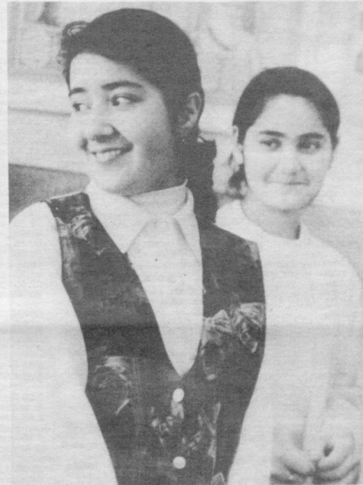
Беғубор ёшлиқнинг гаши бўлакча.