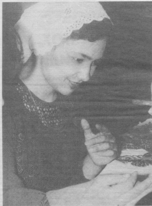
Ҳар бир тикаётган кийимларимда тикувчилик касбининг янги-янгилари сирларини кашф этаятгандекман.