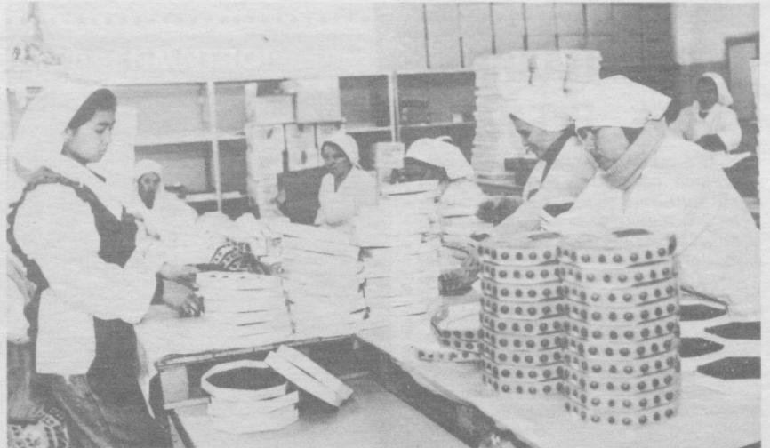
Пойтахтимиздаги «Туфин» қўшма корхонаси жамоасида ишлаб чиқарилаётган ширинликлар нафақат республикамиз аҳолиси дастурхонини безамоқда, балки қўшни давлатларга ҳам экспорт қилинмоқда. СУРАТДА: корхонанинг қадқоқлаш цехида.