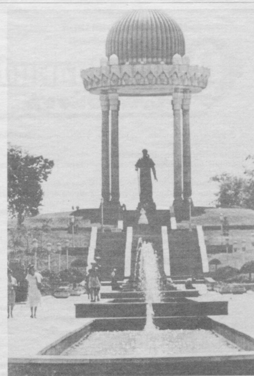
Буюк мутафаккир шоир, шеърят мулкининг султони Алишер Навоий ҳайкали муқаддас қадамжолардан биридир.