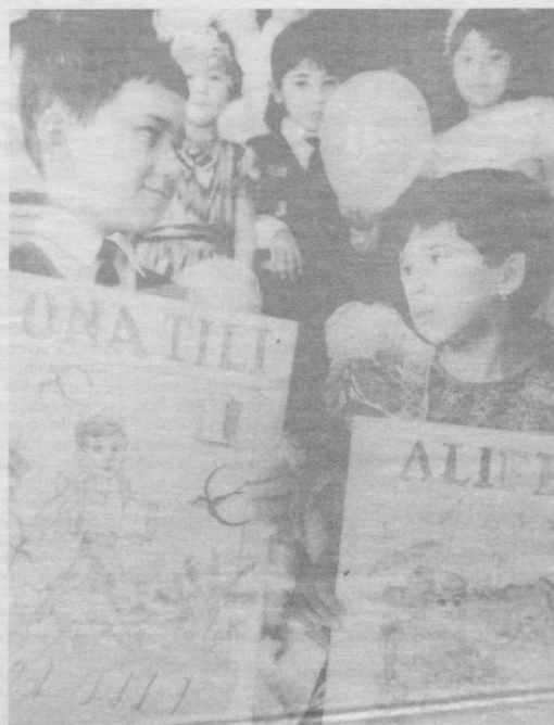
Билим олишга йўл «Алифбе»дан бошланади.