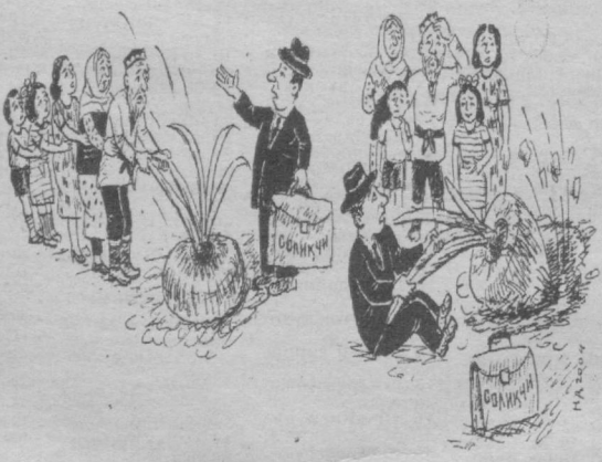
Изоҳга ҳожат йўқ.

Бойкушлар дала ва шаҳарларимизда тун бўйи кезиб, касаллик тарқатувчи ва ҳужалигимизга зарар келтирувчи турли кемирувчиларни кириш билан санитарлик вазифасини ўтайди.