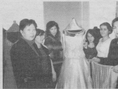
Унинг турмуш ўртоғи билан биргаликда ташкил этган «Санжар-Дил» хусусий фирмаси ҳамда фирма қошидаги «Камола» тикувчилик цехи ва гўзаллик салони шу тариха иш бошлади.

Мана 8 йилдирки, гўзаллик салонидаги тажрибали сарторларнинг ўз мижозлари бор, тикувчилик цехи чеварлари эса Камола яратган дизайнлар орқали турли либослар, хона-