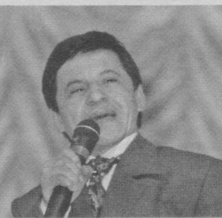
Сиз эл севган қизиқчисиз. Мухлисларингиз саҳна ортдаги ҳаётингизга ҳам қизиқишад.

Сиз уни жуда яхши танийсиз, уни кўрган захотингиз юзингизда ёқимли табассум пайдо бўлади. Унинг ичак узди қажвия-ю, латифаларини, ҳазилга монанд ашулаларини мириқиб, яйраб, мазза қилиб эшитасиз. Кинода ўйнаган роллари эса халқчил ва ишонarli, содда ва самимий, томоша қилганингиз сари кайфиятингиз кўтарилиб, қалбингиз қувончга тўлаверади. Шунинг учун ҳам халқимиз бу қизиқчини севади, эъзозлайди, хар бир чиқишини соғиниб қутади. Шундай қилиб, бугунги суҳбатдошимиз эл севган санъаткор, Ўзбекистонда хизмат кўрсатган артист Обид Асомов.