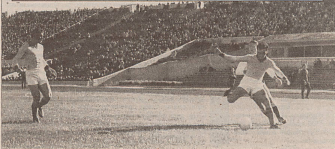
Игра с «Зенитом» в Санкт-Петербурге была одной из самых запоминающихся.