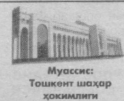
Муассис: Тошкент шаҳар ҳокимлиги