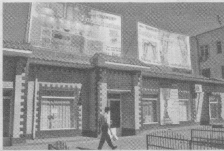
Бозор ва харидор