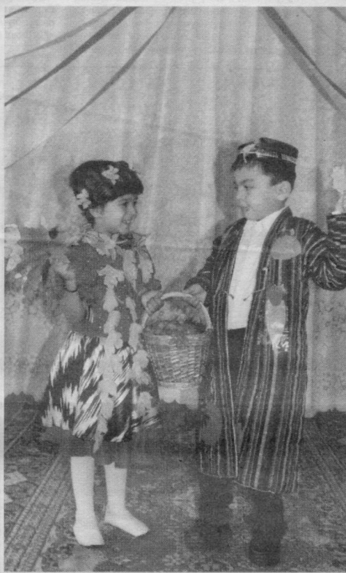
Жонажон боғчамизда дилдан қувнаб ўйнаймиз, Ватанимиз мадҳини доим куйлаб яйраймиз.

Клублар ўртасида эса Тошкент вилояти мотоспортчилари биринчи ўринни эгаллади.