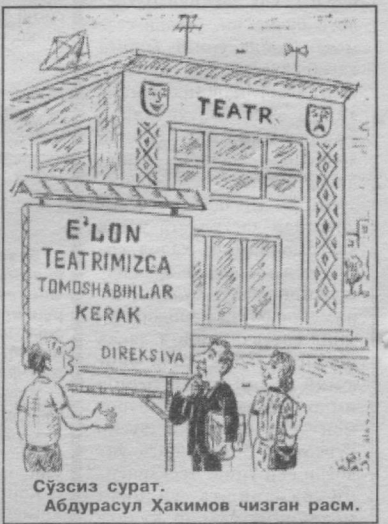
Сўзсиз сурат. Абдурашул Ҳакимов чизган расм.