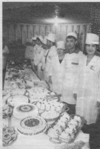
Нон дастурхон кўрки, савлати ҳисобланади. Шириндан ширин турли хил пишириқлар эса ошпазларнинг касб маҳорати нишонасидир.

Тошкент Давлат юридик институтини «Куч билим ва тафаккурда» шиори остида талабалар ўртасида билимдонлар танлови ўтказилди.