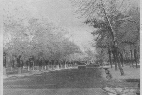
Қировли қишининг завҳи бўлакча.

Идишга 1,5 стакан шакар, 150 грамм сарёғ, 2 ош қошиқ сув, 2 ош қошиқ какао сўлиб оловга қўйиб, қайнаб чиққунча аралаштирилади.