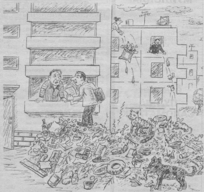
— Ахлат пулини тўламайсизми?

Тирногингизга, сочингизга бир жиддий разм солиб кўринг-а! Бу оддий ва таниш аъзоларда ҳеч қандай сир йўқдек кўринади. Аммо бу янгли тасаввур. Соч-тирноқ инсон дунё юзини кўрмасидан аввал пайдо бўлишини биласиз, ҳойнаҳой. Лекин улар инсон ўлимидан кейин ҳам ўсишда давом этишдан хабардормисиз?