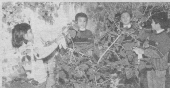
Она-табиат гулу чечакларидан баҳра олиб, уларни парваришлаш ёшу каттанинг энг севимли юмуши.