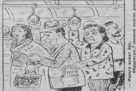
Изоҳга ҳожат йўқ. Абдурашул-Улқимов чизган расм.