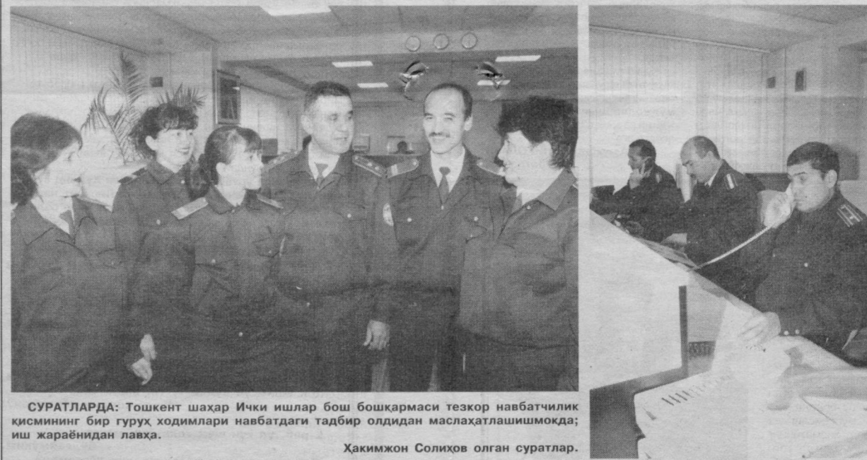
СУРАТЛАРДА: Тошкент шаҳар Ички ишлар бош бошқармаси тезкор навбатчилик қисмининг бир гуруҳ ходимлари навбатдаги тадбир олдидан маслаҳатлашишмоқда; иш жараёнидан лавҳа.