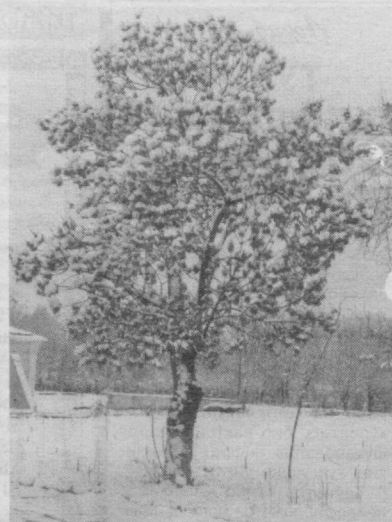
Қишнинг аёзли ва қорли кунлари атрофга ажиб бир сокинлик ва улугворлик бахш этиб турибди.

Ҳар сафар пойтахтимиз бўйлаб ҳаракатланаётган жамоат транспорти воситалари катновидидаги камчилик ва нуқсонлар, йўловчиларнинг ўрилли эътирозлари ҳақида сўз очилганда, болалигимда ўқиган бир эртақдаги мақол ёдимга тушади. «Яхши отга бир қамчи, ёмон отга минг...» деган нақл бежиз айтилмаган.