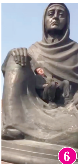
Телеграм асосчиси Павел ДУРОВ:

Ҳўш, биз каерда эътиборсизлик қилаймиз? Ёшлар маънавиятида бўшлик пайдо бўлмаслиги учун яна нималар қилишимиз зарур? Жавобини топгандек бўлдим. Уша йигитларга 15 сутка берилди. Ҳўш, ушбу муддатда улар нимага эришади? Фикримча, ҳеч нимага! Жамиятимиз илдизига куртдек ёпишган бу иллатдан бутунлай қутулиш учун жазо чораларини кескин кучайтириш керак. Токи бу ўйиндан ўт чиқараётганларнинг ҳамма-хаммасига жиддий сабоқ бўлсин.