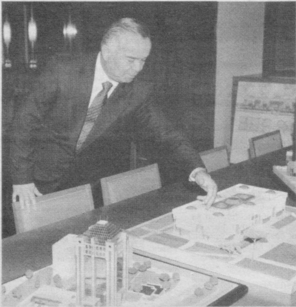
Давоми. Боши 1-бетда

Эски Жўвада бир табаррук маскан бор. Мана, бир асрдан ошдики, у одамларга маърифат, зиё улашиб келади. У нафақат Эски шаҳар аҳли, пойтахтликлар, балки бутун мамлакат зиёлилари яхши биладиган, интиладиган, кўҳна «Турон» кутубхонасидир. Бу кутубхонага кириб Тошкент ва унинг тарихига оид китоблар, қўлёзмаларни varaқлар экансиз, Эски шаҳарнинг юртимиз ҳаётида қанчалик муҳим роль уйнаганини, бу ердан етишиб чиққан не-не алломалар халққа сидқидилдан хизмат қилганининг гувоҳи бўласиз. Кутубхонанинг ўзи юз йиллик тарихга эга, лекин унинг нодир китоблари минг йиллик ўтмишимизнинг кўзгусидир. Чунки, бу ердаги манбаларда Шайх Хованд Тоҳур, Туркистон ва Хуросонда пиру муршид мақомига кўтарилган Хожа Аҳрор Валий, қасидачиликда шухрат таратган шоир Бадриддин Чочий, ҳазрат Навоий ўз таъкирасида меҳр билан тилга олган истеъдод соҳиби Аълоий Шоший, муаррихлардан Банокатий, Хофиз Кўҳакый, Абубакр Шоший, Мирза Олим Тошкандий, Ермухаммад Тошкандий ва бошқа улуг зотлар ҳақида қизиқарли ва ноёб маълумотларни учратиш мумкин.