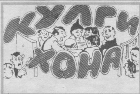
КУЛИНГ ДЎСТЛАР, УМРИНГИЗ УЗОҚ БЎЛАДИ. Юсуфжон қизик Шакаржонов

Орамазда ёши улғурок ҳамкасбимиз бўларди. Ишга жиндай тоби йўрок, устига-устак "қиттак-қиттак" олиб турар, гоҳи пайтлар икки-уч кунлаб ишга келмай ҳам қолар эди.