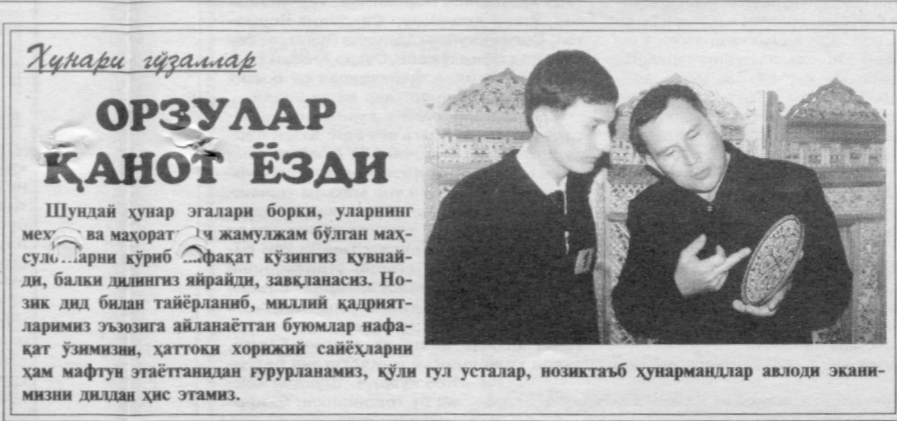
Хунари қўзғалар ОРЗУЛАР ҚАНОТ ЁЗДИ Шундай хунар эгалари борки, уларнинг меҳри ва маҳорати чамулжам бўлган маҳсулотларни кўриб қолмақда кўзингиз қувнайди, балки дилнингиз яйрайди, завқланасиз. Нозик дид билан тайёрланиб, миллий қадриятларимиз эъзозига айланаётган буюмлар нафақат ўзимизни, ҳаттоки хорижий сайёҳларни ҳам мафтун этаётганидан гурурланамиз, қўли гул усталар, нозиктаб хунармандлар авлоди эканлигини дилдан ҳис этамиз.

Анвар устозидан олган билимларини назарий жиҳатдан янада бойитиш мақсадида 1997 йилда Камолитдин Бехзод номли Республика рассом-