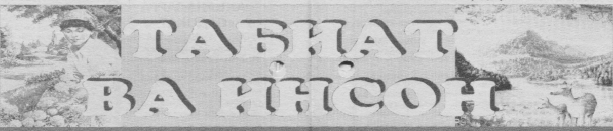
№ 3(155) Тошкент шаҳар табиятни муҳофаза қилиш кўмитасининг саҳифаси

Ш.АБДУЖАЛИЛОВА, Тошкент шаҳар табиятни муҳофаза қилиш кўмитасининг ўсимлик ва ҳайвонот дунёсини химоя қилиш гуруҳи раҳбари.