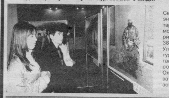
Кўргазмадан 1911-1917 йилларда Сергей Прокудин-Горский томонидан энг сўнгги технология бўйича рангли тарзда олинган Ўзбекистоннинг мейморчилик, амалий санъат, либослар, турмуши ва урф-одатларига оид 38 та ноёб фотосурат урин олган. Улар ўша вақтдаги Ўзбекистоннинг турли шаҳарлари ҳаёти ҳақида тўлиқ таассурот уйғотади. Айниқса Бухородаги арк, Бухоро амири Саид Олимхон, ҳўл мена сотувчи қиёфаси ва бошқа фотосуратлар диққатга сазовордир. Кувонарли томони шундаки, «Че-

«Аския-2005» деб номланган кўргазмада ҳам ана шундай баъзи оғриқли нукталаримиз кулгу остига олиниб моҳирлик билан ифодаланган. Умид қиламизки, мазкур