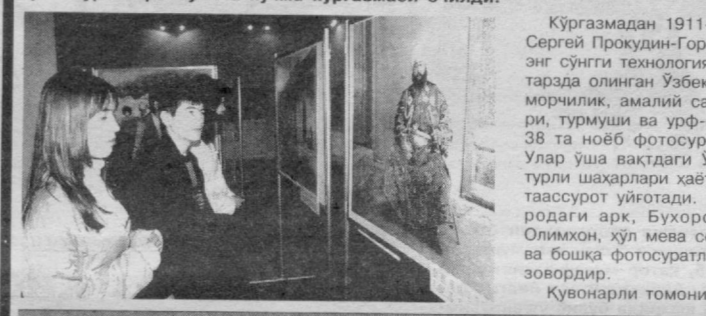
Кўргазмадан 1911-1917 йилларда Сергей Прокудин-Горский томонидан энг сўнгги технология бўйича рангли тарзда олинган Ўзбекистоннинг мейморчилик, амалий санъат, либослар, турмуши ва урф-одатларига оид 38 та ноёб фотосурат урин олган. Улар ўша вақтдаги Ўзбекистоннинг турли шаҳарлари ҳаёти ҳақида тўлиқ таассурот уйғотади. Айниқса Бухородаги арк, Бухоро амири Саид Олимхон, ҳўл мена сотувчи қиёфаси ва бошқа фотосуратлар диққатга сазовордир. Кувонарли томони шундаки, «Че-

Ўзбекистон Амалий санъат музейида Сергей Прокудин-Горскийнинг Марказий Осиё фотосуратлари бўйича кўчма кўргазмаси очилди.