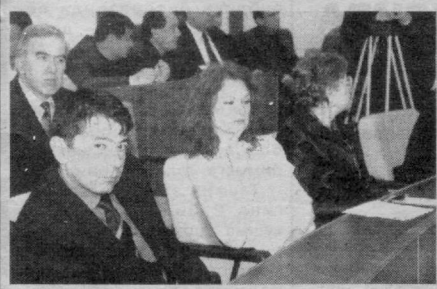
Мазкур форумнинг мақсад ва вазифалари Ўзбекистон Республикаси Президенти Ислам Каримов

Илгари хабар қилганимиздек, пойтахтимизда Саноатчилар ва тадбиркорлар форуми бўлиб ўтди. 300 дан зиёд йирик корхона ва кичик тадбиркорлик субъектлари, шунингдек, давлат ва жамоат ташкилотлари вакиллари иштирок этган анжуман Тошкент шаҳар ҳокимлиги томонидан ЎзЛиДеПнинг шаҳар Кенгаши ва Савдо-саноат палатасининг шаҳар ҳудудий бошқармаси ҳамкорлигида ташкил этилди.