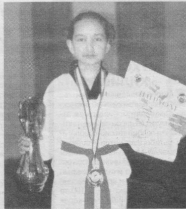
чи, янгийўлликлар эса учинчи бўлишди. Ғолиб ва совриндорлар дипломлар ҳамда кимматбаҳо мукофотлар билан тақдирланди.

Умумжамоа ҳисобида майдон эгалари — тошкентлик спортчилар ҳурмат шохуспасининг энг юқори поғонасидан жой олишди. Қозоғистоннинг Тараз шаҳри спортчилари иккин-