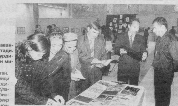
ларимиз ўзларининг оддийгина каламлари билан уларни сермаъно қўлғили ҳамда жонли қилиб расмларда тасвирлашади. «Аския-2005» деб номланган кўргазмада ҳам ана шундай баъзи оғриқли нукталаримиз кулгу остига олиниб моҳирлик билан ифодаланган. Умид қиламизки, мазкур

кўргазма ўқувчилар эътиборини тортти улдарда чўқур қизиқиш уйғотади. «Аския-2005» кўргазмаси 12 апрелгача давом этади. (Ўз мухбиримиз) СУРАТДА: «Аския-2005» кўргазмасидан лавҳа.