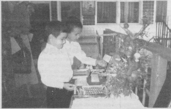
Болалар қадрдон ва қўвноқ маскан бўлмиш боғча қўйида доимо қизиқarli ўйин ва машғулотлар билан банд бўлишади.