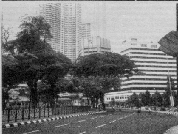
«Жаҳон» ахборот агентлиги материаллари асосида тайёрланди.