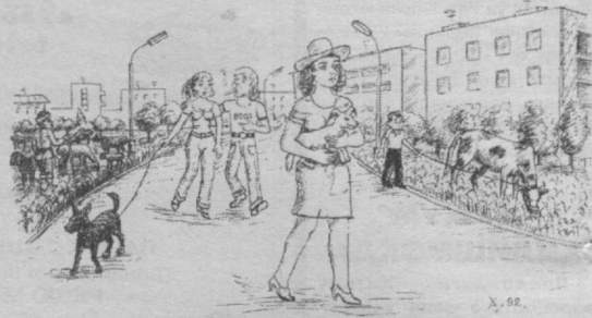
Изоҳга ҳоҳшат йўқ.