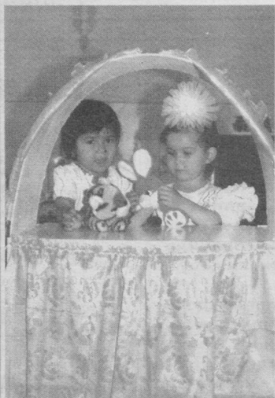
Жажжи кичкинтойларимиз қадрдон боғчаларида ҳар куни мана шундай дилдан қувнаб куйлашиб, қизиқарли ўйинлар ўйнаб, бахтли болалик гаштини сурмоқдалар.

вафот этганини муносабати билан чуқур таъзия ихзор этади.