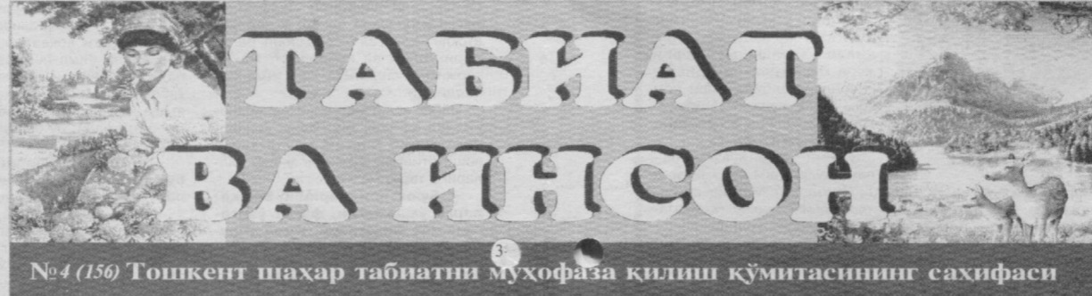
№4 (156) Тошкент шаҳар табиатни муҳофаза қилиш кўмитасининг саҳифаси

«Табиат бежиз онага қиёсланмайди. У ҳам она каби муқаддас, она каби азиз бўлмоғи лозим. Негадир ҳозир аксарият инсонлар табиатни қадрламай, уни беҳурмат қилмоқдалар.