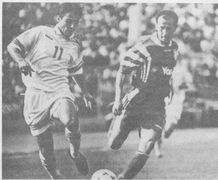
Наврўз айёми арафасида бошланадиган VIII Миллий чемпионат баҳслари мана шундай ҳужумкор ўйинларга бой бўлади деган умиддамиз.