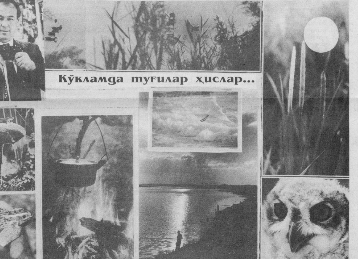
Кўкларда тугилар ҳислар...

Шайхонтоҳур тумани, Ҳабиб Турсунов номи 186-ўрта мактабда иқтидорли, ашчи, шунингдек туман, шаҳар олимпиадаларида голибликни қўлга киритган бир гуруҳ ўқувчилар «Исломобод» маҳалла кўмитаси томонидан ажратилган стипендия билан мукофотландилар. Шу ҳақдаги фикрлар билан танишинг.