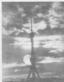
Охири. Боши 4-5 бетларда.

18.25 «Мистер Бин — қора илон». Телесериал. 19.30 «Тафсилотлар». 19.45 «Шаҳарча».