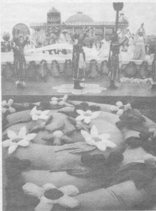
Озод юртимизда Наврўзи олам шуқуи ҳукмор.