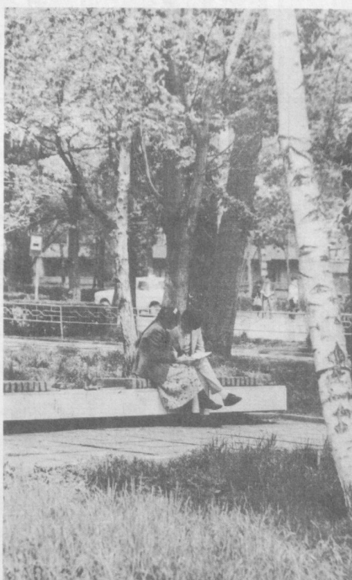
Табиатнинг шундай гўзал думларига шўх рақсларга тушиб, яқин кишилар билан гуллаган дараклар тағидидаги ўриндиқда ўтириб дилдан суҳбатлашишга нима етсин.