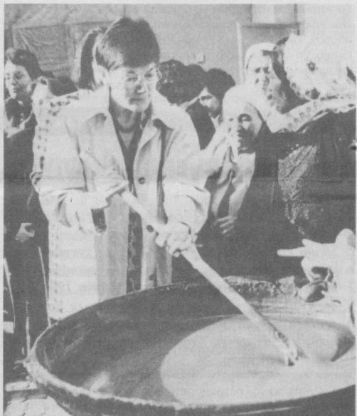
СУРАТЛАРДА: «Гулнора-она» оила марказида Наврўз айёмига бағишлаб ўтказилган тадбирдан лавҳалар.

Унда Ўзбекистонда фаолият кўрсатаётган чет эл элчионалари ва ваколатхоналарида иш олиб бораётган элчиларнинг рафиқалари иштирок этдилар. Катнашчилар баҳорнинг лазиз таомларидан бири бўлган сумалакнинг тайёрлаш жараёни ва бу таом тарихи билан танишдилар.