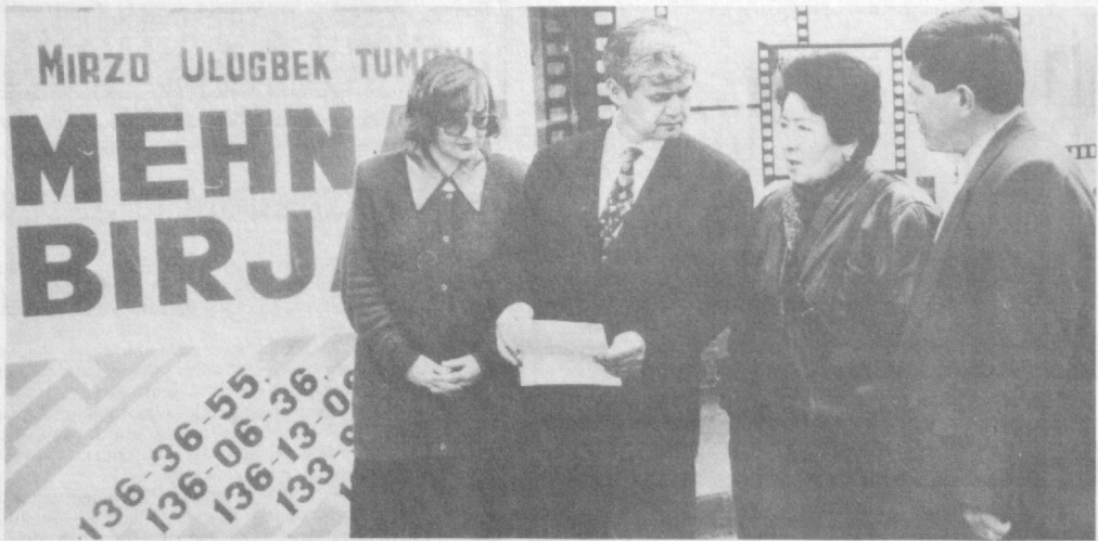
Бугунги кунда шахримизнинг барча ҳудудларида, бошқармалар, маҳалла ва ўқув муассасаларида ёшларни иш билан таъминлаш ва қайта ўқитиш, касб-ҳунар ўргатиш мақсадида талайгина ишлар қилинмоқда. Мирзо Улуғбек тумани меҳнат, аҳолини иш билан таъминлаш ва ижтимоий ҳимоя қилиш органи бу йилги меҳнат ярмарка мавсумини ёшларга бағишлайди.

Бу туман шахримиздаги энг йирик ва аҳолиси кўп туман бўлибгина қолмай, бу ерда бирмунча sanoat, курилиш, илмий-тадқиқот институтлари ҳам жой олган. Унинг аҳолиси 254 минг киши бўлиб, шундан 152,7 минг киши меҳнатга лаёқатлидир. Аммо ҳозирги бозор иқтисодиёти шароитида ишсиз юрган фуқаролар учун меҳнат органи Ўзбекистон Республикасининг «Аҳоли бандлиги тўғрисида»ги қонуни асосида чора-тадбирлар ишлаб чиқмоқда. Шунингдек, меҳнат органи тумандаги бўш иш ўринлари бор бўлган корхоналар ва ташкилотлар учун малакали ходимлар тайёрлаб бериш масъулиятини ҳам олишган. Ўтган йили туманда 1810 киши рўйхатдан ўтиб, 1394 нафар киши ишга жойлаштирилди. 207 нафар фуқаро эса турли йўналишдаги маслаҳатларни олишди, 129 нафари қайта ўқитиш ва малакасини ошириш ўқув марказига юборилди.