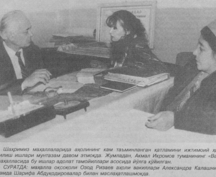
Шахримиз маҳаллаларида аҳолининг кам таъминланган қатламни ижтимоий ҳимоя қилиш ишлари мунтазам давом этмоқда. Жумладан, Ақмал Икромов туманининг «Ватан» маҳалласида бу ишлар адолат тамойиллари асосида йўлга қўйилган.