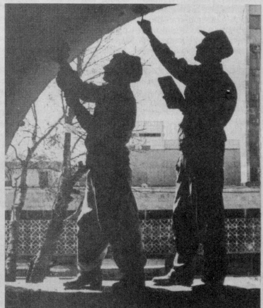
СУРАТЛАРДА: курилиш майдонидан лавҳалар.