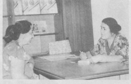
Маҳалла фуқаролар йиғини раҳбари билан мулоқот.

Шуни айтиш ўринлики, жамоада тайёрланаётган маҳсулотлар хорижники билан бозорда рақобатлаша олади. Шу боис ҳам айни кунларда уни хажон бозорига чиқариш учун илқ қадамлар қўйилмоқда. Корхонада 100 нафардан ортиқ ишчи-хизматчи фаолият кўрсатмоқда. Шарофат БАҲРОМОВА.