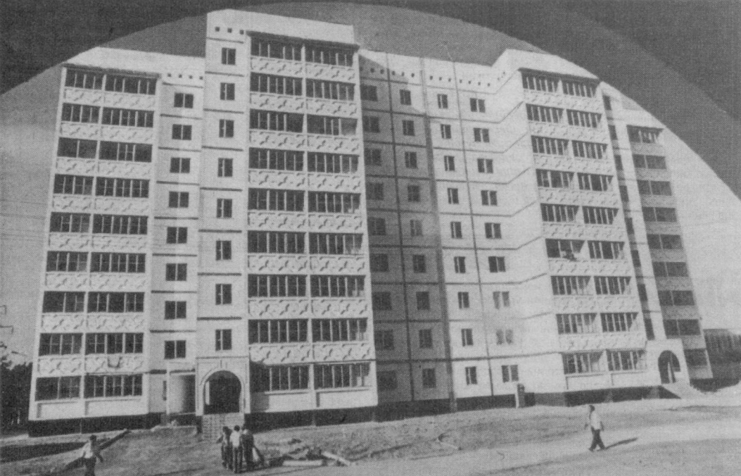
Пойтахтимизда қад кўтарётган замонавий бинолар шахримиз ҳуснига ҳусн қўшмоқда.

Пойтахтимиздаги 8-темир-бетон буюмаля заводидан бири саналади. Бугунги кунда ушбу корхона маҳсулотларига бюртмачиларнинг талаби юқори бўлмоқда. Бу корхонада 200 дан ортик маҳсулот турлари ишлаб чиқарилаётгани ҳам бунинг яққол исботидир.