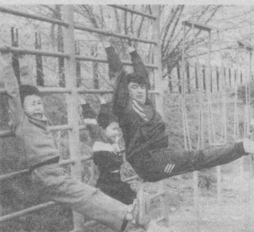
СУРАТЛАРДА: шаҳримиз туманларида ўтказилган «Маҳалла спорт кунини» дан лавҳалар.