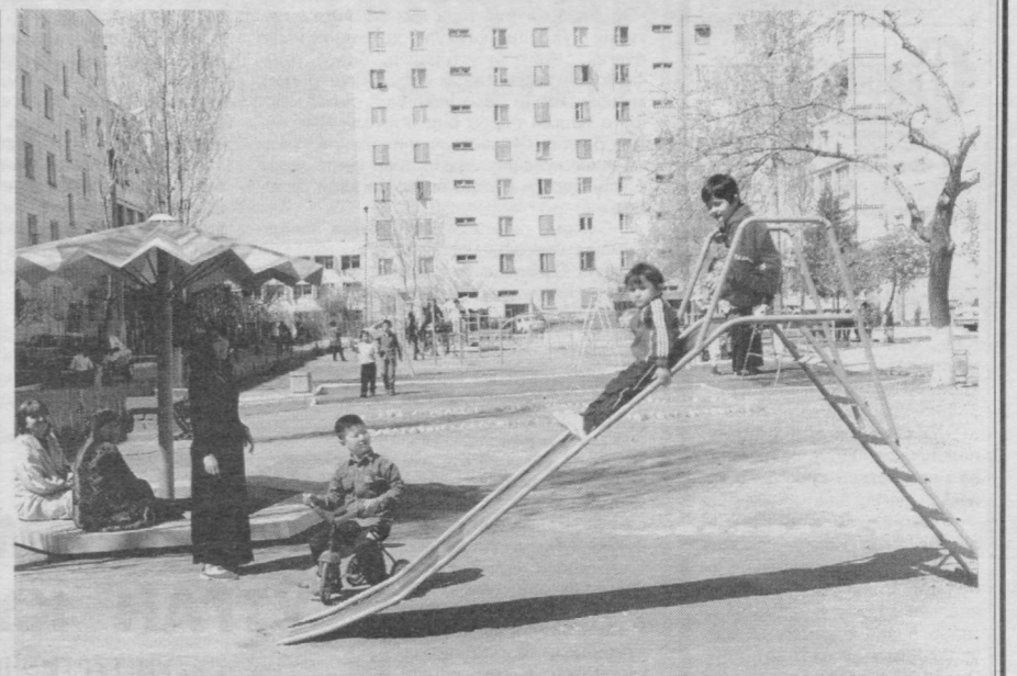
Кўп қаватли уйларда болажонларимизнинг жисмонан ва маънан соғлом бўлиб вояга етишлари учун барча шарт-шароитлар яратилмоқда.

Маҳаллада ёшларни спортга, касб-хунарга жалб этиш, уларнинг бўш вақтларини бекорга ўтказмасликларини таъминлаш мақсадида «Мактаб-маҳалла» ларга доимий ёрдамини уюштириш, худудда кичик корхоналарни ташкил этиш, янги ишчи ўринларини яратиш, жиноятчиликнинг олдини олиш бўйича побсон ва профилактика инспекторлари билан биргаликда яқиндан иш олиб бориш, мулкдорлар билан ширкатлар ўртасидаги шартнома, унинг маъмурий муҳияти бўйича аҳолига тушунтириш ишларини олиб бориш каби қатор хайрли мақсадлар қўзланган.