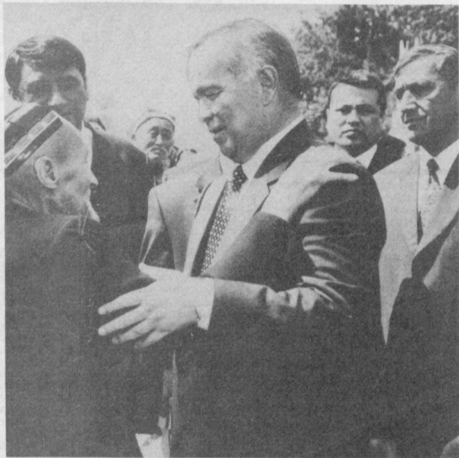
Газетанинг шу сонига