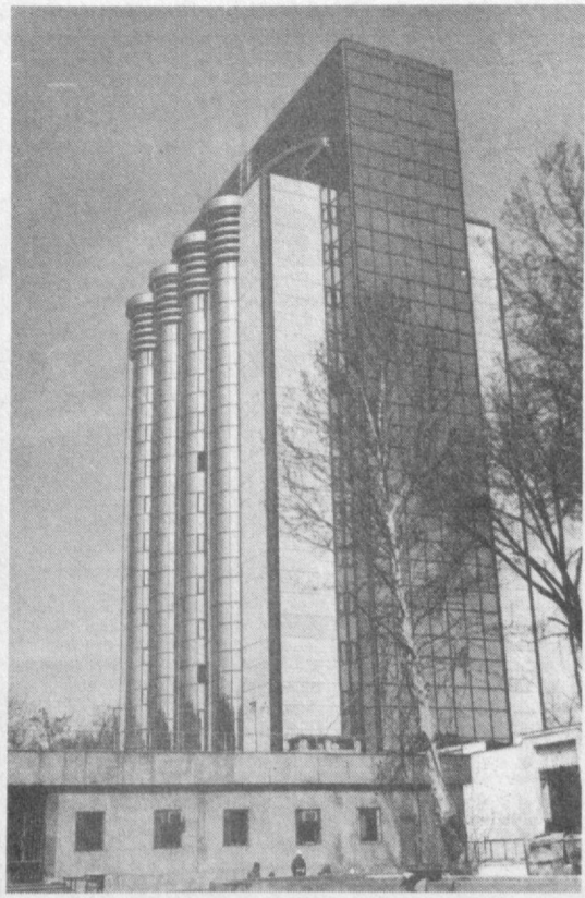
Шахримиз обод ва кўркам бўлиб бормоқда. Бу ерда қўлаб турар жой бинолари, маданий-маиший объектлар қад кўтармоқда. СУРАТДА: марказий банк биноси кўриниши.