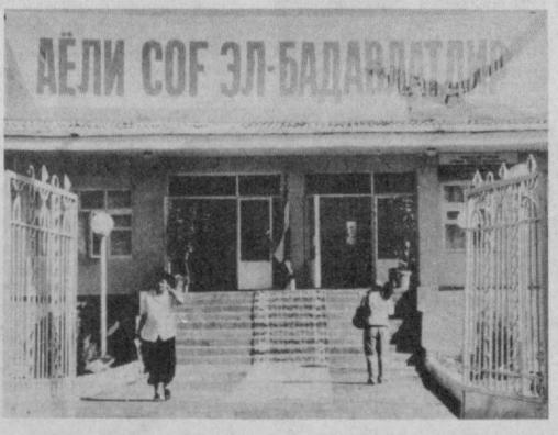
«Аели Соф» эл-бадавлати.

Хуллас, мулкдорлар синфини шакллантириш, уларнинг ўз фаолиятларининг натижалари учун молиявий ва иқтисодий масъулиятларини ошириш давримизнинг энг долзарб вазифаларидан бири сифатида эътироф этилди. Бу эса ҳар бир ишдаги муваффақиятларимиз, фаровон ҳаётни таъминлашдаги иштирокимиз натижалари ўз қўлимизда эканлигининг яна бир ёрқин далилидир.