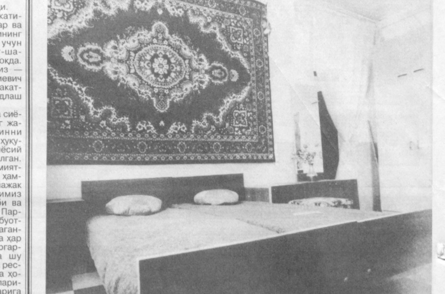
Пойтахтимиздаги «Сергели» мебель бирлашмаси ҳиссадорлик жамияти мебелсозлари харидорбоп маҳсулотлар ишлаб чиқариб, халқ эҳтиёжини қондиришмоқда. СУРАТДА: мебелсозлар томонидан тайёрланган «Гўзал» ётоқхона термаси.