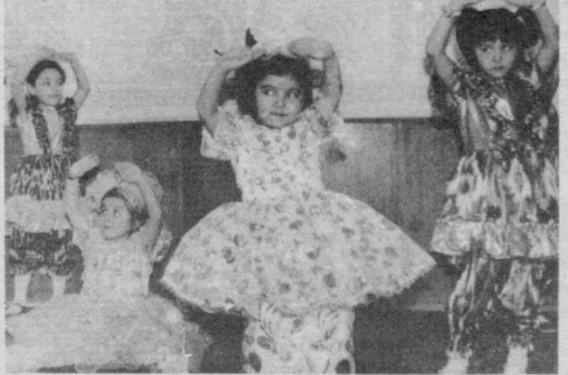
Кичкинтойлар санъати барчамизга завқ бағишлайди. Засим Соколов олган сурат.