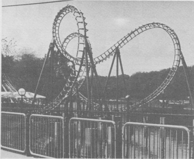
Дам олиш масканларида...

Яқинда пойтахт қасаба уюшмалари кенгашининг VI пленуми бўлиб, Тошкент шаҳар уюшмалари кенгашининг Ўзбекистон Республикаси Президентини Ислам Каримовнинг Олий Мажлис ўн тўртинчи сессиясидаги нутқидан келиб чиққандан вазифалари ҳамда меҳнат жамоаларида хотин-қизларнинг ролини ошириш, уларнинг меҳнат шартини яхшилаш, маънавий ва маданий ривожланиши таъминлаш борасидаги ишлари тўғрисидаги масала юзасидан Кенгаш раиси М. Содиқова маъруза қилди.