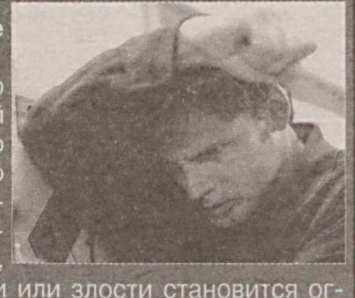
В ролях: Эрик Бана, Дженнифер Коннелли, Сэм Эллиотт.

20.45 «ХАЛК» В результате неудачного эксперимента, блестящий ученый доктор Брюс Баннер подвергается воздействию гамма-лучей и превращается в Халка - существо невероятной физической силы,