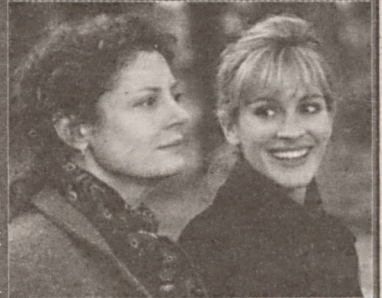
В ролях: Джулия Робертс, Сюзан Сарандон, Эд Харрис.

21.10 «МАЧЕХА» В жизни двенадцатилетней Анны и семилетнего Бена появилась Изабель, любовница их разведенного отца.