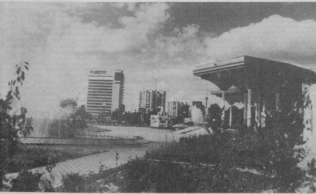
БУГУНГИ ТОШКЕНТ.