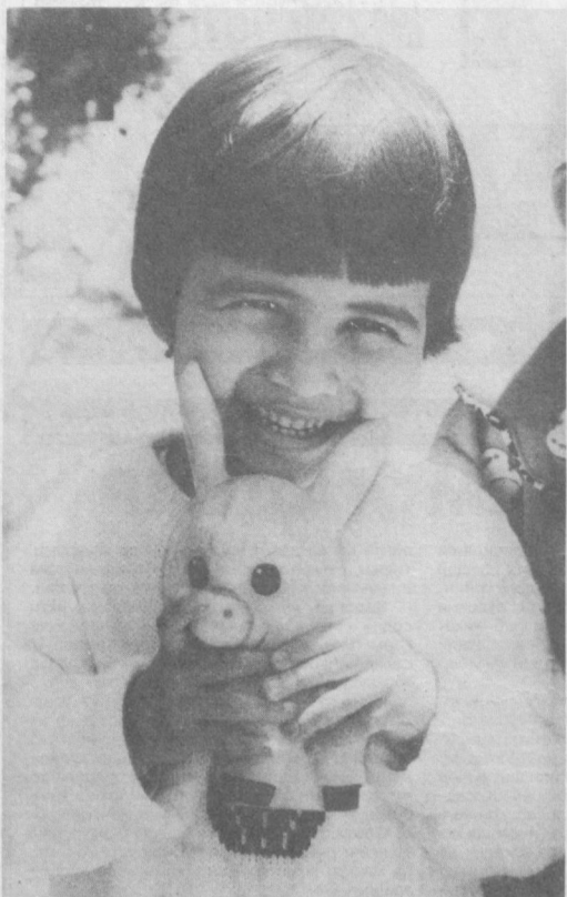
«Фарзандларимиз биздан кўра кучли, билимли, доно ва албатта бахтли бўлиши шарт», деб бежиз таъкидламаганлар.

муассасаларида «Соғломжон» — полвонжон» саломатлик спорт мусобақаси ўтказилади. Барча қатнашчилар, кам таъминланган оилалар фарзандлари ҳамда яқинлари ва сийлигида қолган болаларга турли совғалар, хусусан, кийим-кечак, ўқув қуроллари ҳадя этилади. Бугунда мамлакатимизда ўғил-қизларнинг нафақат жисмоний етуклигига, балки маънавий жиҳатдан ҳам баркамол бўлиб етиштирилишига аҳамият берилмоқда. Шу боисдан, Ҳиндистон маданият маркази билан биргаликда маданият марказида барча тумандаги болаларга Ҳиндистон маданиятини ўрганишга бағишланган байрам тадбири ўтказилади. Унга халқлар маданиятига ҳурмат билан қарашни, улардаги уйғунлиқни кашф этишларида муҳим ўрин тутувчи ушбу тантананда болалар ҳинд куй-кўшиқларини, рақсларини тинглаб томоша қилиш билан бир қаторда ўз истиснод