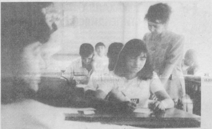
Мақтабларда имтиҳонлар муваффақиятли ўтмоқда.

Шайхонтоҳур тумани Қоратоп маҳалласида «Ҳамиша дилимиздасиз» дея номланган хотира кечаси ўтказилди.