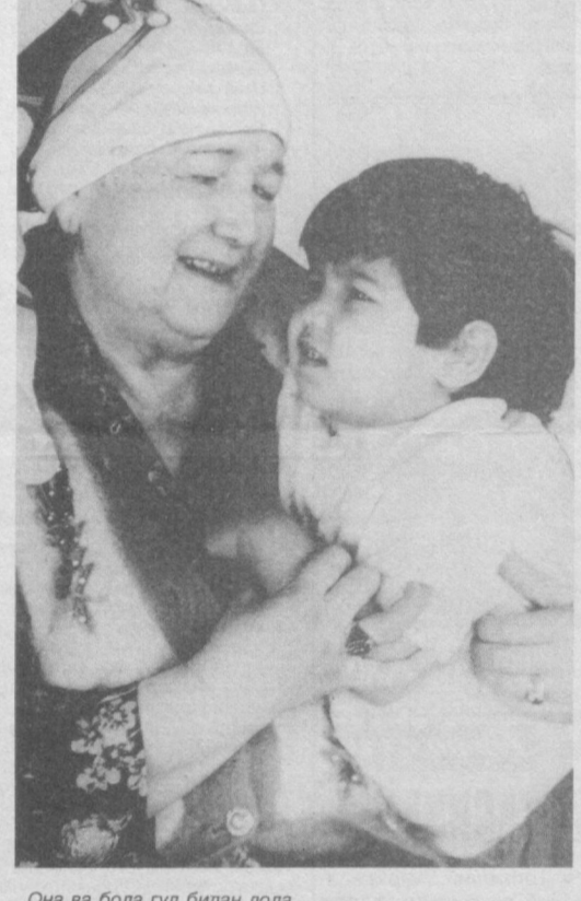
Она ва бола гул билан лола.