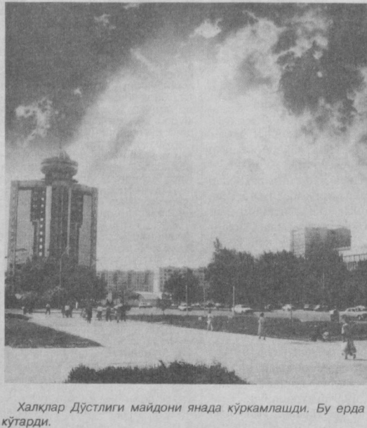
Халқлар Дўстлиги майдони янада кўркاملашди. Бу ерда «Бизнес маркази» биноси қад кўтарди.

Маълумки, қадим-қадимлардан Шарқда устозлик ва шоирлик тушушчалари жуда муҳим роль ўйнаб келган. Маҳмуд ҳам ушбу тамойилларга қатъий риоя қилиб келади.