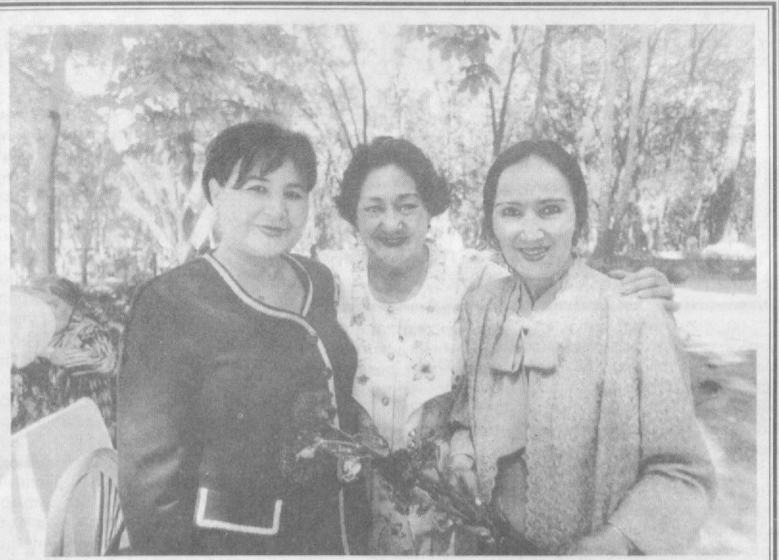
1999 — Аёллар йили