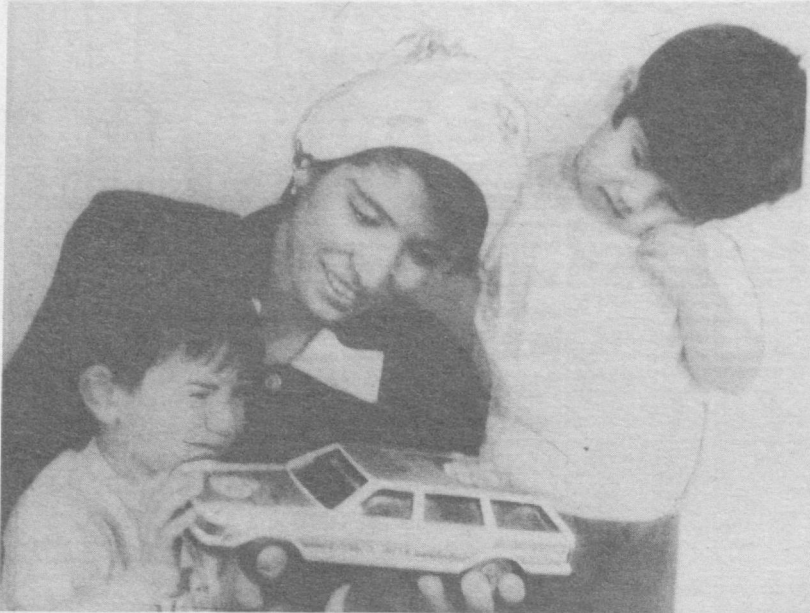
Катта бўлсам ҳайдовчи бўламан.