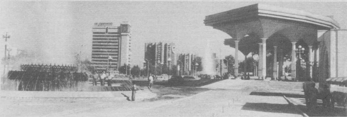
Амир Темур кўчасидаги «Олой» бозорининг олд кўриниши.