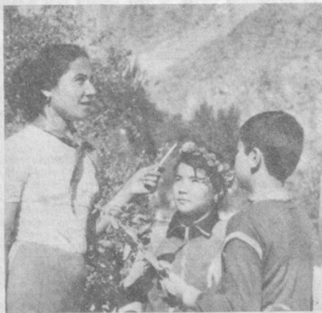
Олтин ёз — ўтмоқда соз

Совет спортчилари бу йил жуфт бўлиб ўйнашда айниқса муваффақиятли иштирок этаптилар. Масалан, икки вақилими — Л. Савченко билан Н. Зверева рақибларини енгиб ҳал қилувчи матчда йўллана олган эдилар. Улар финалда ГФРлик Ш. Граф ва аргентиналик Г. Сабатини билан учрашди. Бу йилнинг ўйнашларида ҳам теннисчилар қатнашмоқдалар.