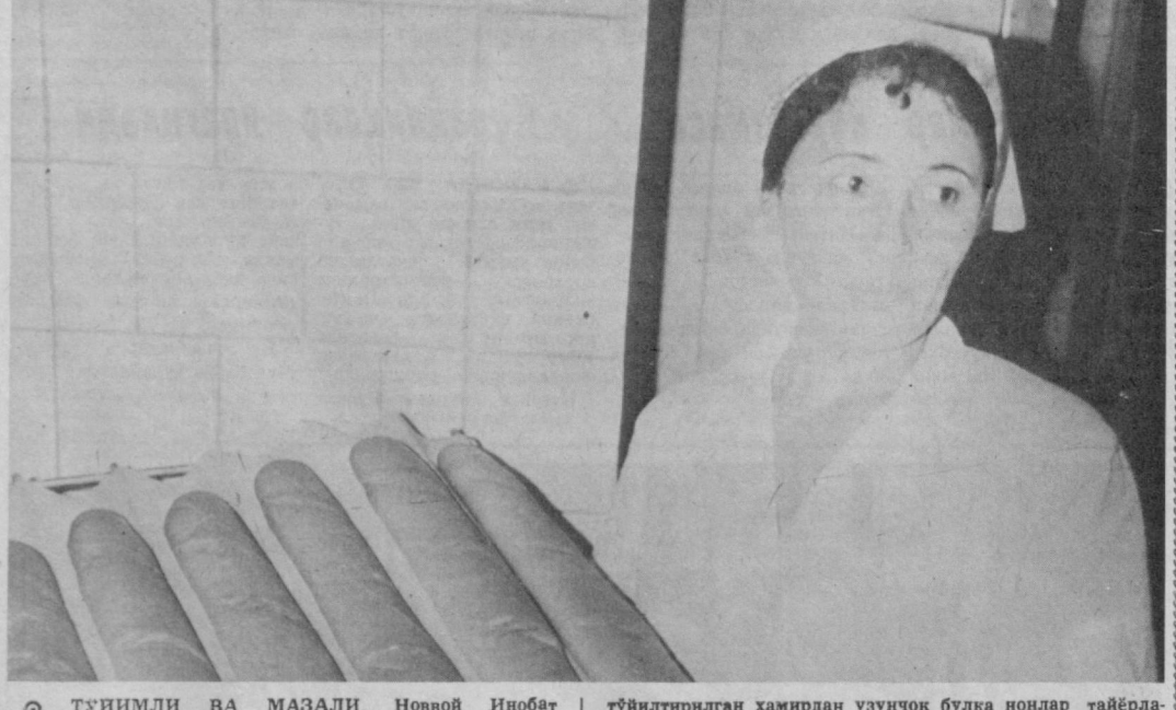
© Тўғинли ва Мазали. Новвой Инобат Сулаймонова 1-нон заводи қошида очилган янги цехда меҳнат қилади. Бу цехда харидорғир маҳсулот — тўғилтирилган хамирдан узунчоқ булка нонлар тайёрланади.

бўламыз, ундан ана шу ташкилотга аъзо бўлган мамлакатларнинг ҳар бири эркин фойдалана олади», — деди у. КОБУЛ. Афғонистон шимолдаги Ҳоузгон ҳақида Қобул вилоятининг Мирбақор қўрт музофотида «Афғонистон ислом партияси» (АИП) ва «Афғонистон ислом жамияти» экстремистлари ўртасида шартнома тўлашувлар бўлиб ўтди. Жангарилардан 120 дан зиёд киши ҳалок бўлди ва яраланди. Баҳтар агентлигининг хабар қилишича, Урузгон ва Ғазна вилоятларида мана ярим йилларни, АИП, «Афғонистонни овоз қилиш ислом уюшмаси» ва «Афғонистон ислом инқилоби ҳаракати» билан «Афғонистон ислом бирлиги партияси» отрядлари ўртасида жанглар давом этмоқда. Ҳозирги пайтга қадар 200 дан кўпроқ одам ҳалок бўлди, юзлаб киши яраоқатланди. Тинч аҳоли ўртасида ҳам қўрбонлар бўлди, маҳаллий аҳоли ҳўжаликларида катта зарар етказилди; бир неча минг бош қорамол, экинзорлар, боғлар йўқ қилинди. 1100 дан кўпроқ афғон қочқорлари чет элдан Ҳирот, Нимрўз ва Кандаҳор вилоятларига қайтиб келишди.