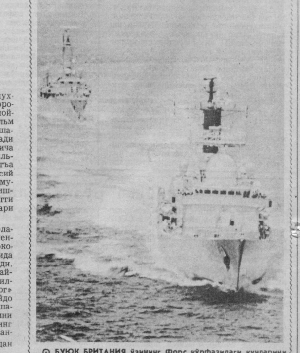
© БУЮК БРИТАНИЯ ўзининг Форс кўрфаздаги кучларини қўпайтириш ҳақида қарор қабул қилди. Мудофая министри Британия ҳарбий-деңгиз кучларининг яна уч кемасини шу минтақага юборишини эълон қилди. Шундай қилиб Шарқий Ўрта ер деңгизига йўл олган учта миња изловчи кемани қўшиб ҳисоблайдиган бўлса, Форс кўрфазиди ҳамда унинг беэвосита яқинида турган кемаларини умумий сонини ўн биттага етати. СУРАТДА: «Жупитер» фрегатини кўрфаз кудудиди.