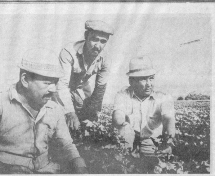
Ленин номи колхоз пахтакорлари Пискент районда биринчи бўлиб ғўзага тўртинчи ишлов беришни тугалладилар. Хўжаликда ҳамма пайкаллардан экин агротехника қондаларига мувофиқ шароити қилинмоқда. Дехқонлар бу йил гектаридан пландаги 23 центнер ўрнига 25 центнердан сифатли оқ олтин етиштириш мажбуриятини олишган. Дала ишлари ўзаро социалистик мусобақа асосида йўлга қўйилгани тўғрисида тез ва соз ўтказилган.

Ушбу қарор қандай бажарилаётганлиги Ўзбекистон Компартияси Марказий Комитетининг секретариатига ҳар ойда кўриб чиқилсин. Назорат қилиш вазифаси Марказий Комитетнинг иккинчи секретари ўртоқ В. П. Анничев, ташкилий-партиявий ишлар бўлими ва партия контроли комиссияси зиммасига юксатилсин.