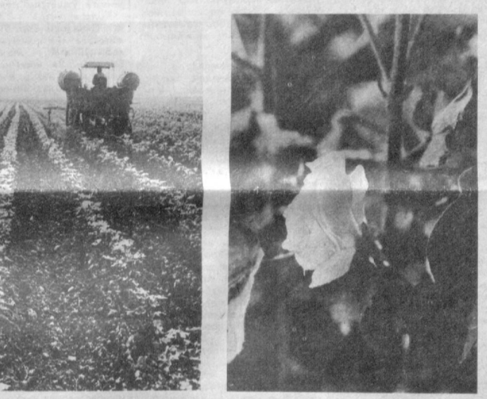
СУРАТЛАРДА: 1. Колхоз правлениеси раиси Ғўта Бўриев (ундан), моҳир суви Шарофиддин Омонбоев ва механизатор Эшқаб Қайитбоев ғўза ривожини кўзда кечиринмоқда. 2. Ниҳолларга ишлов бериш пайти. 3. Ғўза туғли.