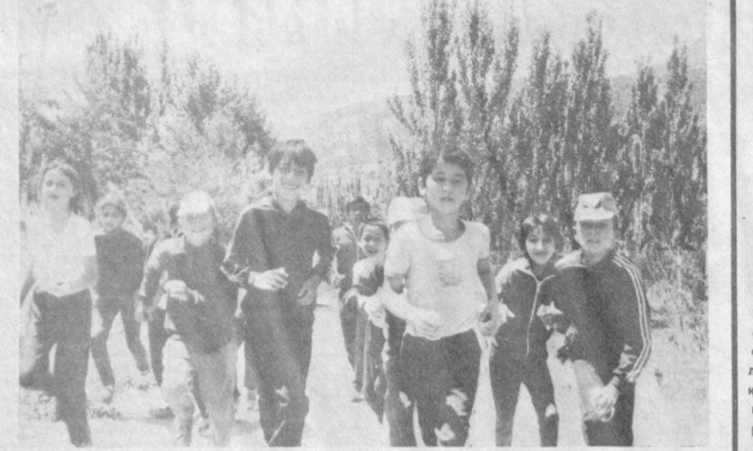
СУРХОНДАРЕ ОБЛАСТИ. «Нефтяник» пионерлар лагерининг футбол мусобақалари. Ушбу ҳафтада спорт мусобақалари, зукколар баҳси мунтазам ўтказилмоқда.

«Спартак» (Москва) — «Динамо» (Минск) матчи билан мамлакат чемпионатининг олий лигаси навбатдаги тур унвонларига эришилди.