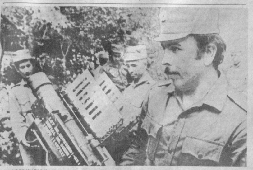
АФГОНИСТОН. Ҳукуматнинг маълуматда тинчлик ўрнатилган ҳолатда тинчликни таъминлашга қарамай маҳаллий реакция ташкилотлар, шунингдек уларнинг чет эллардаги гушталари оёсийликка раҳна солишга уринмоқдалар.

ДАМАШҚ. АҚШ олтинчи флотини ва Исроил ҳарбий денгиз кучларини составининг кемалари келгуси икки ҳафта мобайнида биргаликда машқлар ўтказди.