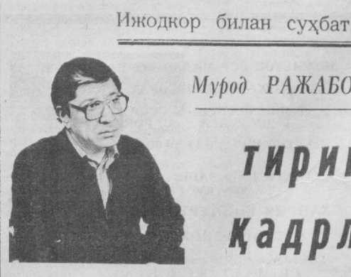
Ижодкор билан суҳбат

— Муроджон ака, эндиликда сиз таниқли киноактерсиз. Сухбатимизни санъат йўлидаги илк қадамларингиз қандай бўлганидан бошласан. — 1966 йили Н. А. Островский номидаги театр ва расмчилик санъати олийгоҳининг актёрлик куллиётига ўқишга кирдим. «Еш гвардия» театрида (1966 йилдан) эпизодик ролларда иштирок этдим. Ҳар бир ишнинг ўз масъулияти бўлади.