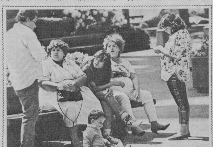
○ АМЕРИКА ҚЎШМА ШТАТЛАРИ. Тошкент билан биродарлашган Сиятл шаҳри манзараси.

курашини керак эмас, беморларни даволаш зарур. Деб ўқитди у. Яқин кунлар ичида яна тўртта даволаш машғулотли, шу жумладан Кошицадаги 8460 ўринли амфитеатрда машғулот ўтказилади. (ТАСС).