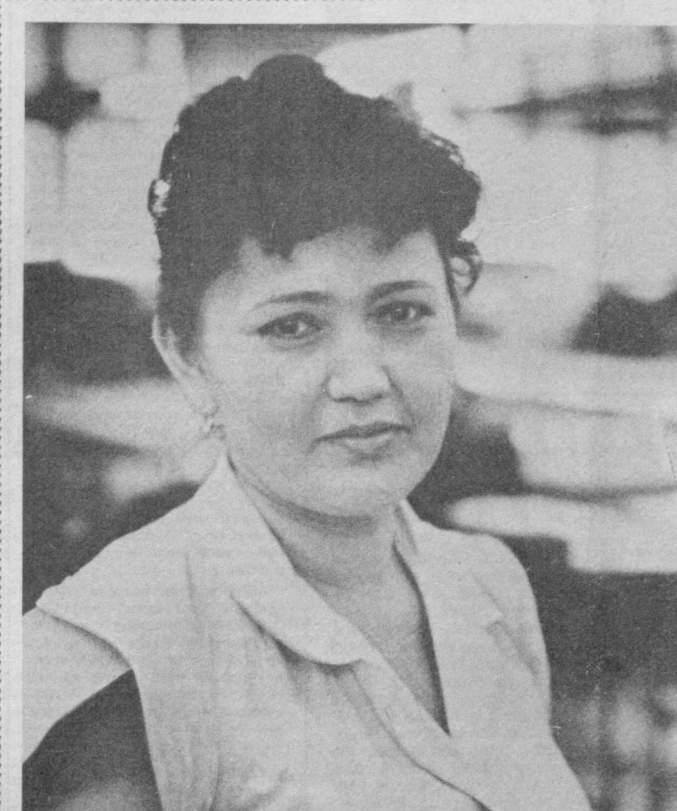
ИШЧИНИНГ ОРЗУСИ. Ўзбекистон ССР ва Ўзбекистон Компартиясининг 50 йиллиги номидаги тикувчилик ишлаб чиқариш бири...