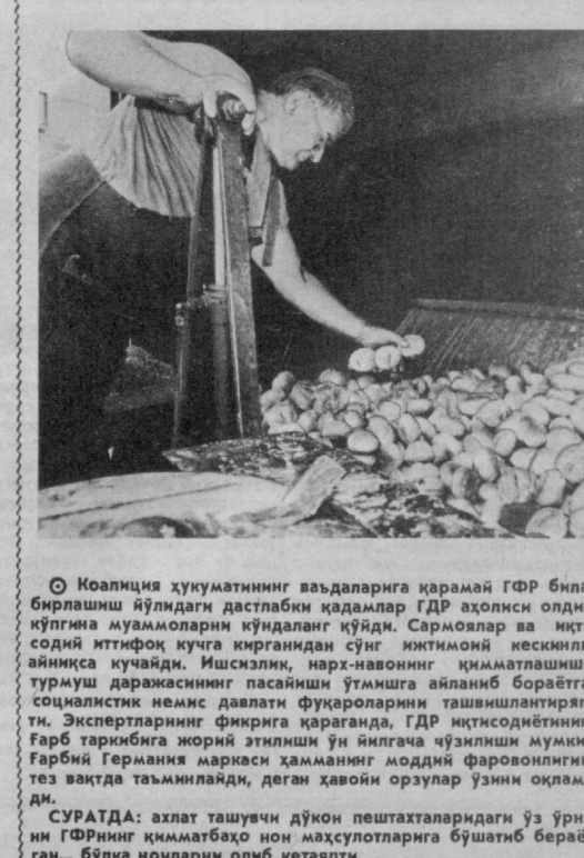
© Коалиция ҳукуматининг ваъдаларига қарамай ГФР билан бирлишга йўлдоғи дастлабки қадамлар ГФР аҳолиси олдига кўпгина муаммоларни кўздан кўйди. Сармоялар ва иқтисодий иттифоқ кучга кирганидан сўнг жимитиш қисқилиши айнакча кучайди. Ишчилар, нарт-навонинг қилматлаши, турмуш даражасининг пасайиши ўлашга айланб бораётган социалистик немис давлати Фукарларини ташвишлантирди. Экспертларнинг фикрига қараганда, ГФР иқтисодийнинг ГФР таркибига жорий этилиши ўй йилгача қўрилиши мумкин. ГФРнинг Германия маркази ҳаммамнинг моддий фаровонлигини тез вақтда таъминлашга, деган ҳавоий озулар ўзини оқлайди.

БМТ ҳавфсизлик кенгаши қабул қилган қарорда жуда зарур бўлиб қолган тақдирда Ироқ еки Қувайтга у ердаги муҳожирилари ва маҳаллий аҳоли учун озиқ-овиқ маҳсулотларини етказиб бериш кўзда тутилди. Қарорда таъкидланишича, ердан етказиб бериш бу тақсимлаш халқаро Қишлоқ Хўжалиги билан ҳамкорликда БМТ орқали амалга оширилиши лозим. Ироқ бу масалаларда халқаро агентликлар билан алоқа қилмоқчи эмаслиги маълум қилди.