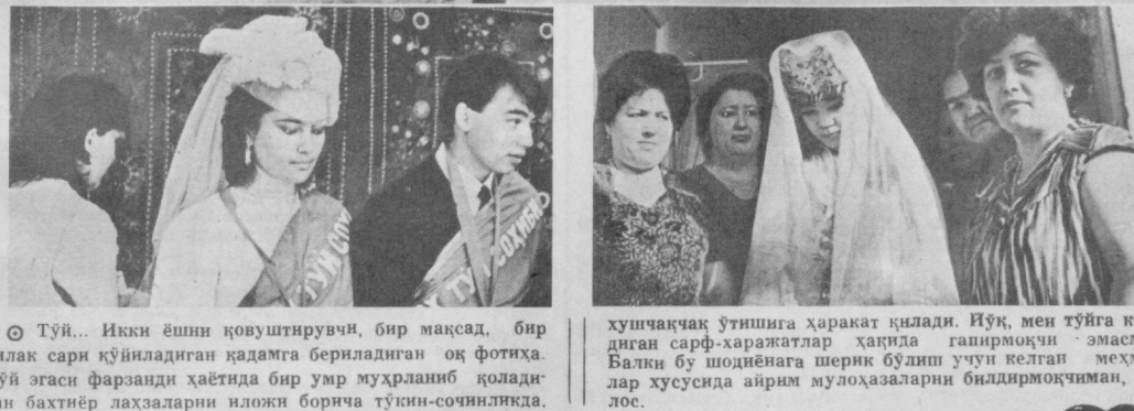
○ Тўй... Икки ёшни қовуштирувчи, бир мақсад, бир тилак сари қўйилдиган қадамга берилдиган оқ фотиҳа. Тўй эгаси фарзанди ҳаётда бир умр мухрланб қолдиган бахтиёр ләҳзаларни илҳом борица тўйини сочинилди.