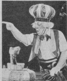
○ Яқинда Ленин горкисидеги циркда Москва жамоатчилиги ва пойтахт меҳмонлари кўш юбилейни: энг машур масхарабоз, СССР халқ артисти Олег Константинович Поповнинг турилган кўнига 60 йил тўлишини ва ижодий фаолиятининг 40 йиллигини нишонладилар. Байрам томошаси кўрсатилиб, бутун оқшом юбиларнинг ўзи аренада бўлди. СУРАТДА: Олег Попов.