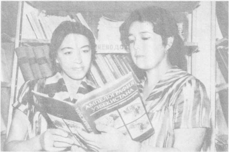
Р. Р. Шредер номидаги илмий-ишлаб чиқариш бирлашмасининг Жнззах филиали бой кутубхонага эга. Бу ерда бодгорчилик, ўсимликшунослика онд иккинчидан зиёд нобит китоблар сақланмоқда.