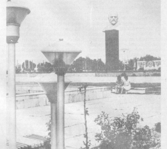
Чўлқуварлар шаҳри — Гулистон йилдан-йилга чирой оциб, обод бўлиб бормоқда. СУРАТДА: шаҳар марказидаги Ленин майдони.

— Н. Рамазон 1986 йилнинг 25 майда ҳам Термизга даволанишга жўнатилган. — дейдиши бизга хукуқ-тартибот органларининг ходимлари.