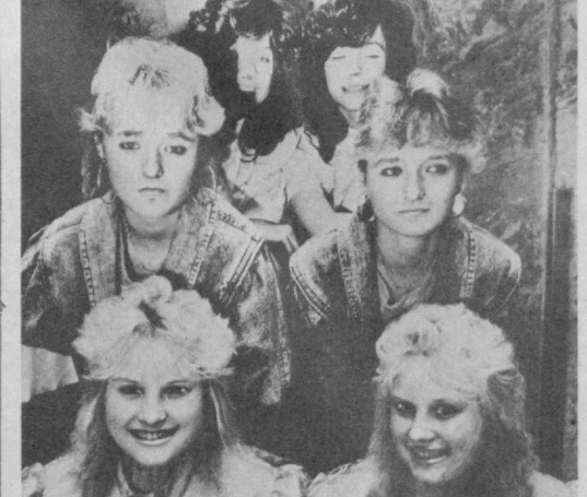
Эгизаклар барча мамлакатларда кўпчилигининг диққат марказида туради. Эшитган бўлсангиз керак, эгизаклар таниловлари, уларнинг учрашувлари ўтказиб турилади. СУРАТДА: мана бу эгизак ола-сингиллар эса кинога тушиш учун таклиф қилинган. Ким биледи, вақти келиб, улар эркан юлдузларига айланишар!

БУДАПЕШТ. «Машинанинг бир чеккага қўйиб, бу ёнига пидеа кет» — Венгрия кўкатпарварлар партияси даъватларида бирини таъмин шундай ифоделаш мумкин. Улар Будапешт ва айниқса унинг марказий қисми ҳаво ҳавасини соғломлаштириш юзасидан шоссининг чоралар кўрилишини таклиф этмоқда. Уларнинг фикрича, шаҳарда тўнг вазиет вужудга келган. Ҳар йили «кўктемол» қилинадиган саломатлик учун зарарли моддалар қарийб 400 минг тонна, аҳоли жон бошига ҳисоблаганда эса кунига бир килограмм қурум ва бошқа химиявий чиқиндиларни ташкил этади.