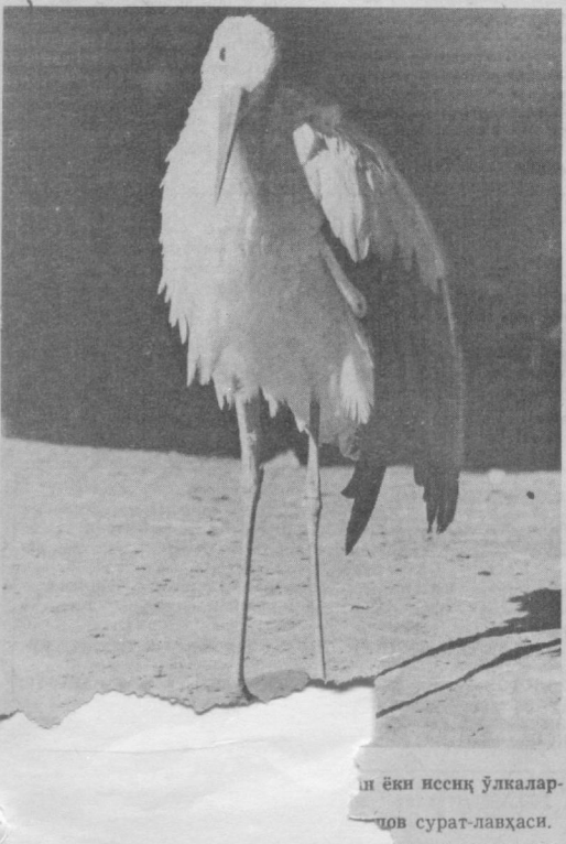
© Ёш икки ўлкалар — сурат-лаҳзаси.

ВОҒБОНДАН бахт нимада, деб сўрашганда: «Шинил мевада!» бастақордан бахт нимада, деб сўрашганда: «Екимли куйда!», учувчидан сўрашганда эса: «Баланд парвозда!», деб жавоб берган экан. Билмадик, бу саволлар рўйхатини яна қанча давом этириши мумкин, аммо шуниси аниқки, сиз унга одамлардан хилма-хил жавоб олишингиз турган гап. Ҳаммаси битта нарсасига бориб тақаллаверади: ҳар ким бахтини ўз қалбига, ўз оруз-ўйига яқин тасаввур этаверади. Ҳаётнинг камалак сингаги ранг-барангнинг, зотан қизгари ҳам шунда: бахтин ҳар ким ўзига ҳар хил тасаввур этишди!