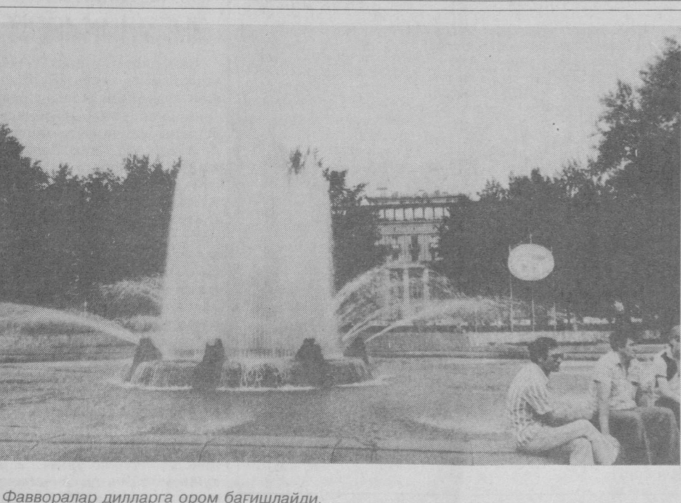
Фавворалар дилларга ором бағишлайди.

Харидор топилмас сеवेга бузун, Номоҳрам тўшақда илғайман дилхун, Уктам ҲАКИМАЛИ.