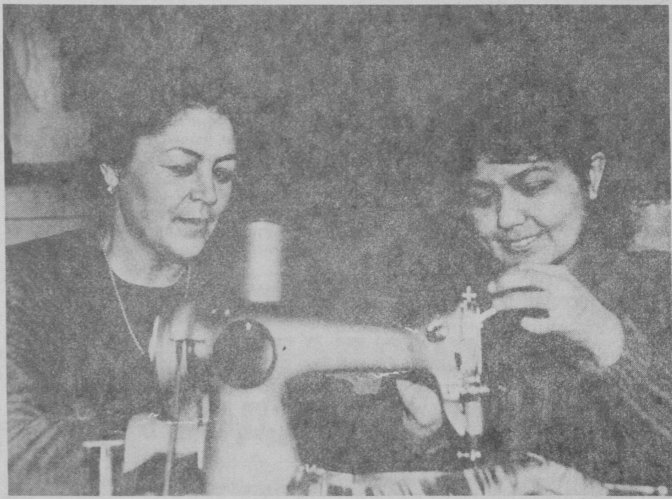
Устоз ва шогирд амалий машғулот устида.