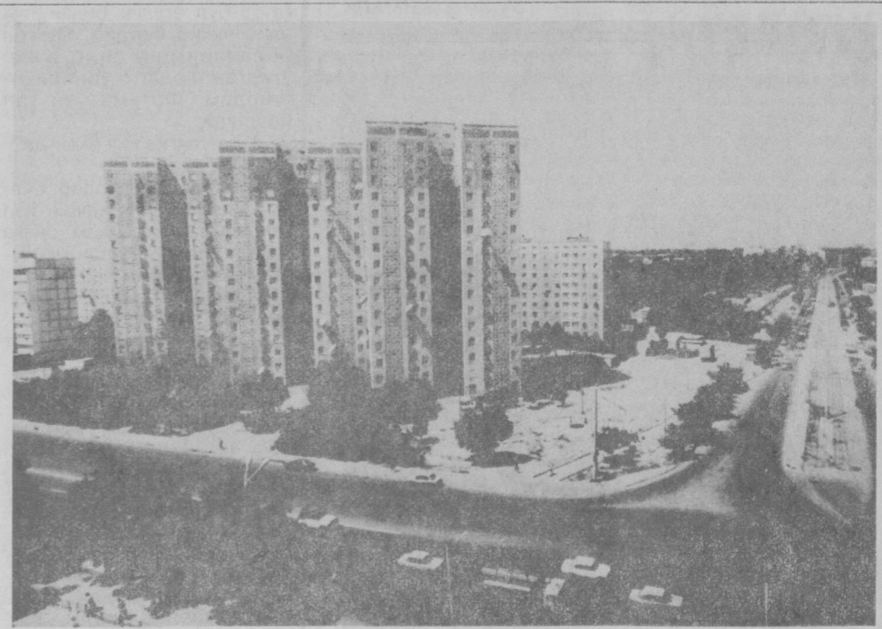
Кўп қаватли бинолар шаҳримиз кўрки.

Польшалик мутахассисларнинг фикрича, мамлакатдаги яна мингга яқин мўъажжанига телефон станцияларини шамолдан қувват олиб ишлашга ўтказиш мумкин.